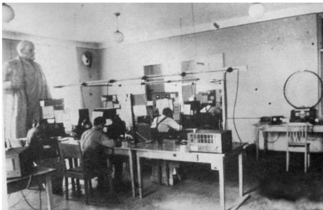
Kuunteluhuone vunna 1942 Sortavalan Vaalijalassa.