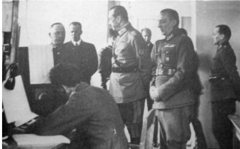
Marski vierailulla Vaalijalassa Sortavalassa.