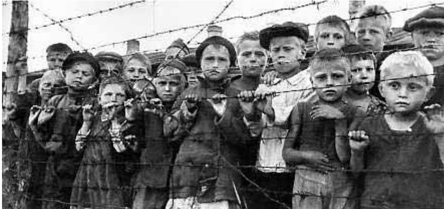
Koncentrationsläger i Petrozavodsk i sovjetiska Karelen. Bara i den trakten fanns det sex läger.